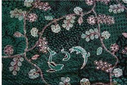
Gambar 1. Batik Motif Suro and Boyo