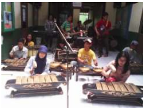
Gambar 1 : siswa SMP IPIEMS dalam berlatih seni gamelan berbasis garap musik kreatif

SMP IPIEMS Surabaya, adalah salah satu sekolah menengah adalah sekolah yang dijadikan lokasi oleh peneliti dalam mengembangkan materi ajar seni gamelan berbasis garap musik kreatif karena selain peneliti sebagai guru seni gamelan di sekolah tersebut, SMP ini juga merupakan salah satu sekolah menengah pertama yang mempunyai gamelan dan alat-alat instrumen musik yang lengkap sehingga peneliti akan bisa lebih maksimal dalam mengembangkan materi ajar agar pembelajaran seni gamelan yang dilakukan di sekolah-sekolah yang bertujuan untuk melatih siswa untuk selalu berkreatifitas dan membangun mandiri creativepreuneru mengajak siswa untuk konser pertunjukan. Berikut proses yang dilakukan siswa SMP IPIEMS dan pentas yang dihadiri artis budi do re mi :