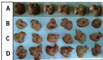
Gambar 2. Warna hepar di setiap kelompok. (A). Kelompok P0; (B) P1; (C) P2; dan (D) P3

Gambar 2 di atas menunjukkan bahwa pemaparan obat anti nyamuk elektrik yang mengandung allethrin secara makroskopis dapat mempengaruhi perubahan warna organ hepar pada tikus. Berikut tabel mengenai hasil penilaian perubahan warna organ hepar berdasarkan kriteria yang telah ditentukan.