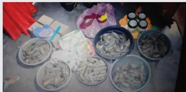
Gambar 4 : Pisang Rebus

sebagai bentuk sopan santun. Namun karna adanya penolakan, buah pisang yang sudah direbus tadi beralih menjadi peluru untuk perang. Pisang sebagai senjata itu umumnya di letakkan di dalam wadah besar yang disebut baskom . Menurut penuturan narasumber, alasan dipakainya buah pisang karena salah satu hasil bumi yang terkenal di Surantih adalah pisang batu medan. Sehingga buah pisang adalah buah yang mudah untuk didapati di daerah tersebut.