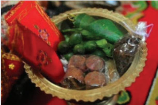
Gambar 5 : Siriah Langguai

makna. Setiap acara, pasti berbeda-beda artinya. Dalam acara parang pisang ini, siriah langguai dimaknai sebagai permintaan maaf dan ajakan berdamai”.