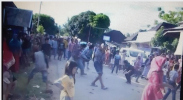
Gambar 2 : Proses Pelemparan Pisang

"Kalau ndak namuah di amankan gunuang rajo batu mandamai jalan urang ka bangkahulu kalau nak cocok pakailah damai kalau nak parang giiang lah paluru". (Kalau tidak mau di damaikan antara anak gadis dan buang maka secepatnya harus ke kantor penghulu kalau tidak cocok maka berdamailah agar tidak terjadi salah paham kedepan).