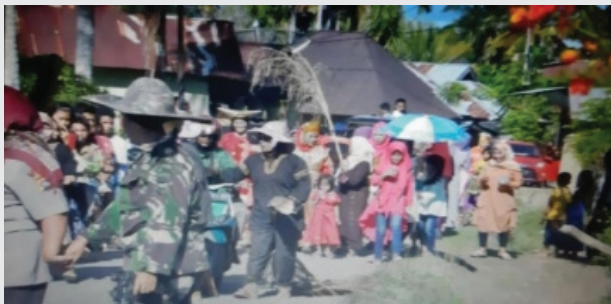
Gambar 1 : Arak-arakan Keluarga Induak Bako

Prosesi tradisi parang pisang dimulai dengan arak-arakan keluarga Induak Bako menuju rumah keluarga si bayi (rumah keluarga perempuan). Mereka membawa bakul (tempat nasi) yang berisi penuh dengan pisang rebus. Pisang tersebut, nantinya bukan untuk dimakan bersama, melainkan sebagai “senjata” untuk dilemparkan ke keluarga perempuan. Dalam arak-arakan keluarga induak bako itu, terdapat pula si muntu , kudo kepeng , anak daro . Selama arak-arakan berlangsung diiringi dengan musik tradisional seperti talempong dan sarunai . Kemeriahan arak-arakan ini disaksikan oleh seluruh warga kampung di sekitar.