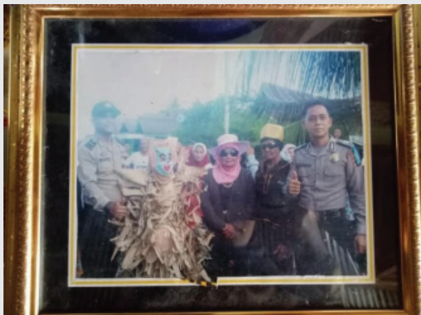
Gambar 3 : Si muntu

Sementara ( Kedua ) simbol non verbal dalam tradisi parang pisang ini terdiri dari beberapa benda atau objek yang digunakan dimana juga memiliki makna di dalamnya. Adapun objek atau benda yang digunakan dalam tradisi itu sebagai berikut: (a). Si Muntu , dalam hal ini si muntu adalah orang yang memakai atribut dari daun pisang kering. Seluruh badannya ditutupi oleh daun pisang dan mukanya memakai topeng. Si muntu dimaknai sebagai boneka yang dibawa sebagai hadiah oleh keluarga induk bako . Dalam acara hiburan, si muntu bertugas sebagai penghibur untuk masyarakat dimana si muntu akan berlari-lari mengejar anak-anak atau warga yang menyaksikan acara tersebut.