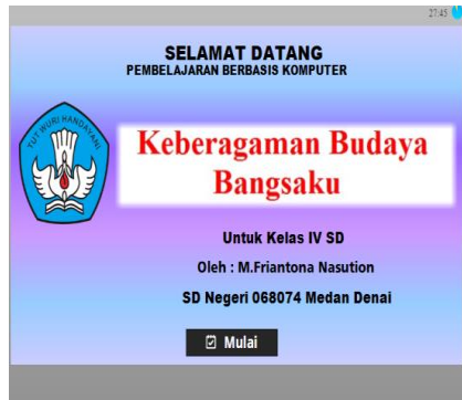
Gambar 3. Tampilan Depan Media Articulate Storyline 3