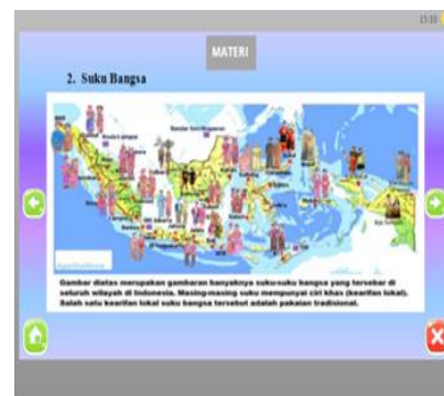
Gambar 2. Isi Materi Media Articulate Storyline 3