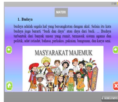
Gambar 1. Isi Materi Media Articulate Storyline 3

dua tahap menghasilkan produk berupa Media Articulate Storyline yang layak untuk siswa kelas IV SD.